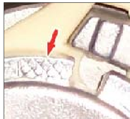
Slika 3: Križna gravura

Mjera istrošenosti je prikazana na križnoj gravuri kućišta natezača pored izreza za namještanje nominalnog položaja napetosti remena (vidi sliku 3).