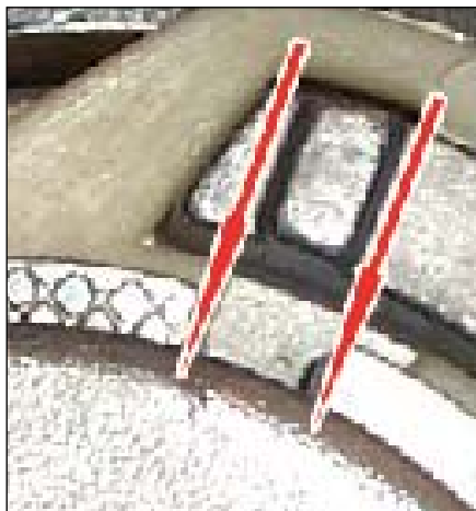
Slika 4: Oba ruba pokazivača jesu u izrezu (strelice). Ispravno namješteno!

Novi zupčasti remen je ispravno nategnut, kada su oba ruba pokazivača namještena u smjeru izreza. Prilikom rada se zupčasti remen troši i isteže. Natezač ovakvo „produljivanje“ zupčastog remena kompenzira ekscentričnim zakretanjem. Oba ruba pokazivača se pomiču na križnu gravuru. Radi osiguravanja besprijekorne funkcije ovog indikatora istrošenosti, mora se uvijek zamijeniti u kompletu natezači, klizači i zupčasti remen. LuK-AS preporučuje koristiti komplet za razvod INA - KIT 530 0082 10 (s zupčastim remenom), jer sve rollice pogona zupčastim remenom podliježu utrošenosti koja je prouzročena uslijed rada. Kada je već na raspolaganju novi zupčasti remen u OE kvaliteti, preporučuje LuK-AS koristiti komplet za razvod INA - SET 530 0082 09 , (bez zupčastog remena).