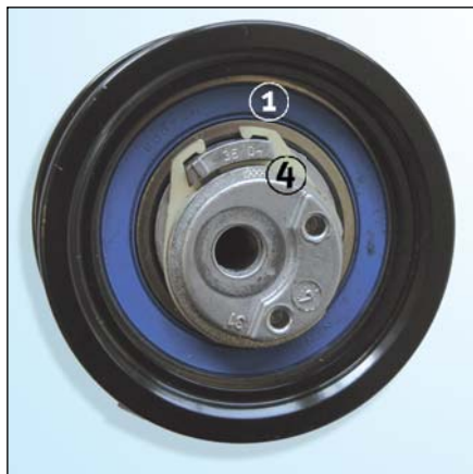
Slika 1: 531 0440 30

038 109 243 038 109 243 D 038 109 243 F 038 109 243 G 038 109 243 H 038 109 243 N