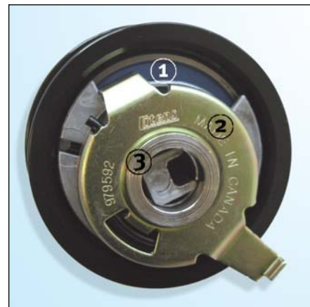
Slika 2: 531 0440 30