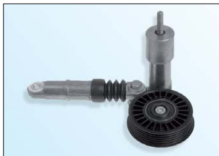
Slika 1: 534 0014 10

S obzirom na nedostatak prostora, u ugrađenom stanju stručno rastavljanje natezača remena nije moguće.