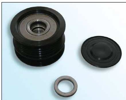
Slika 1: 535 0116 10