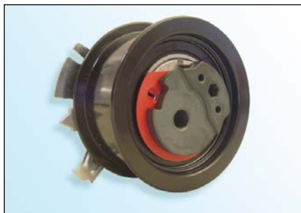
Slika 1: 531 0628 30 (stara izvedba)