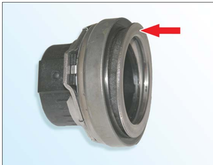
Slika 1: 500 0035 10